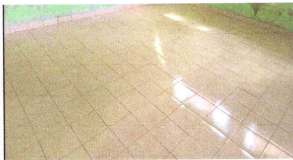
FOTO 3: Sustitución de piso liquido por piso cerámico Modulo de aula