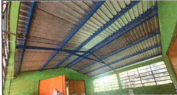
FOTO 2: Sustitución de estructura de soporte de metal por metal Modulo de aula