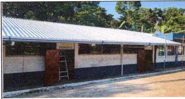
foto 1: Sustitución de lámina, por lámina troquelada aluzinc calibre 26 en Modulo de aula