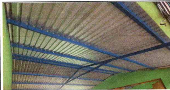
FOTO 5: MANO DE OBRA Instalación de estructura portante de metal Modulo de aula